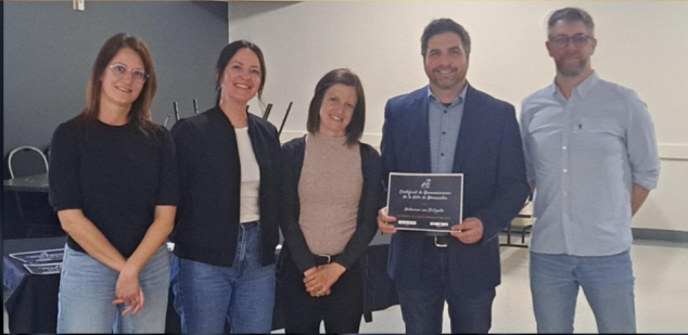
HALLOWEEN SUR ST-CYRILLE