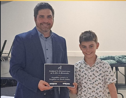
COMPÉTITION AMICALE À LA PUMPTACK AUX GRANDS JARDINS