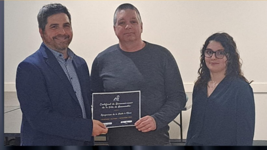
SYMPOSIUM DE LA CHUTE À L'OURS