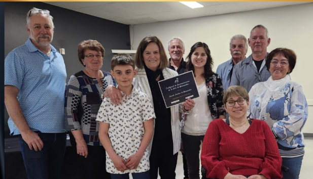
LES GRANDS JARDINS